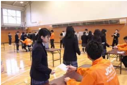
11月例会 『新社会へ飛び立とう、自らの想いを一票に！』 ～若い力でまちづくり～