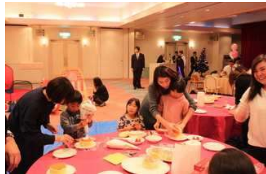
12月例会 ♪一足早いクリスマスパーティー♪