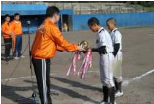
一般社団法人 士別青年会議所 理事長杯 少年野球大会新人戦