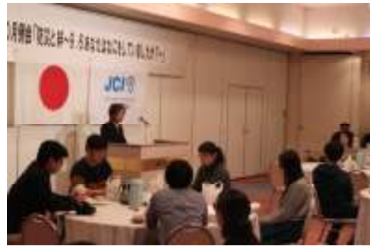
10月例会 防災と絆 ～9.6あなたはなにをしていましたか？～